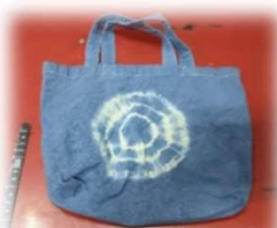
綿バック900円(約20cm×26cm持ち手含まず)